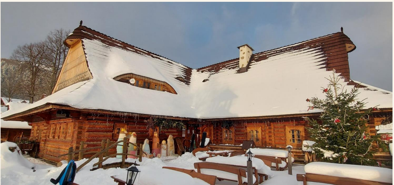
Késő délután egy búcsúebédet (és egy pohár Cinzanot) fogyasztottunk ebben a Kolibában, majd irány Budapest!