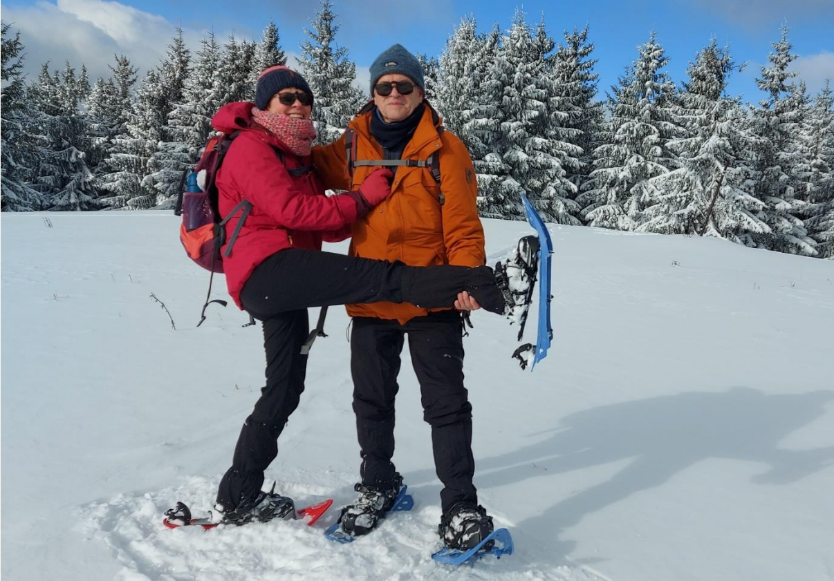
Egy kis lábnyújtózatás Donovaly fölött.