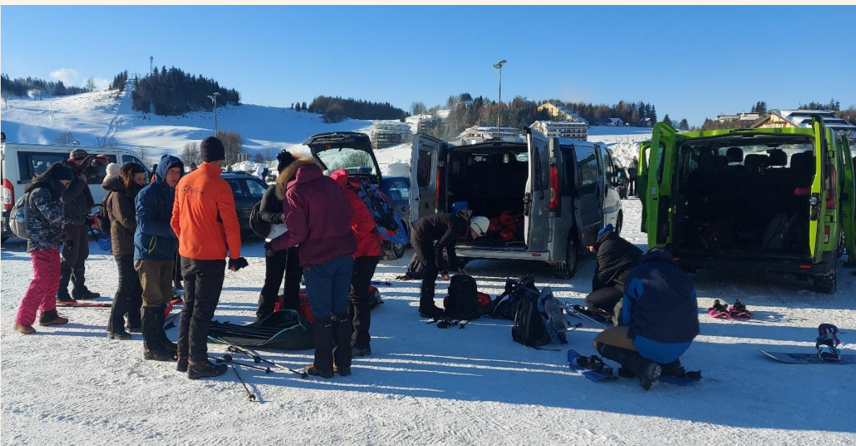
hótalpakat szátosztottuk, sielők balra, hótalpasok jobbra...